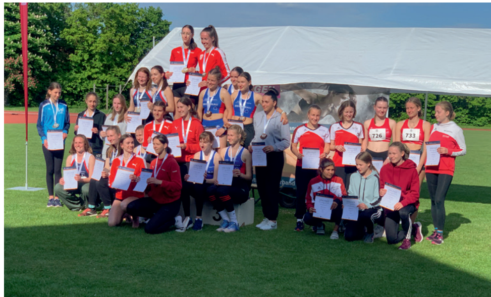
Gruppenbild Siegerehrung Bayerncup mit dem SWC Regensburg