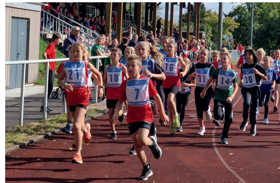
Stadioncross, KiLA in Wiesau