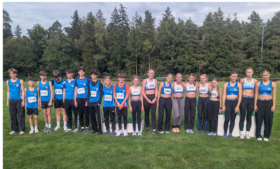
Team Oberpfalz beim Bezirkevergleich M/W 14 in Roth