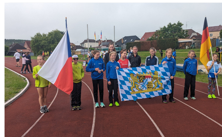
Grenzüberschreitender Schülerwettkampf Oberpfalz mit der Region Pilsen im Mai in Nýřany/CZ