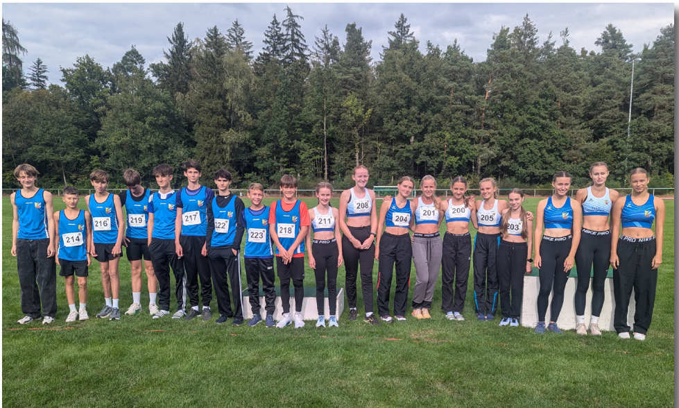
Team Oberpfalz beim Bezirkevergleich M/W 14 in Roth