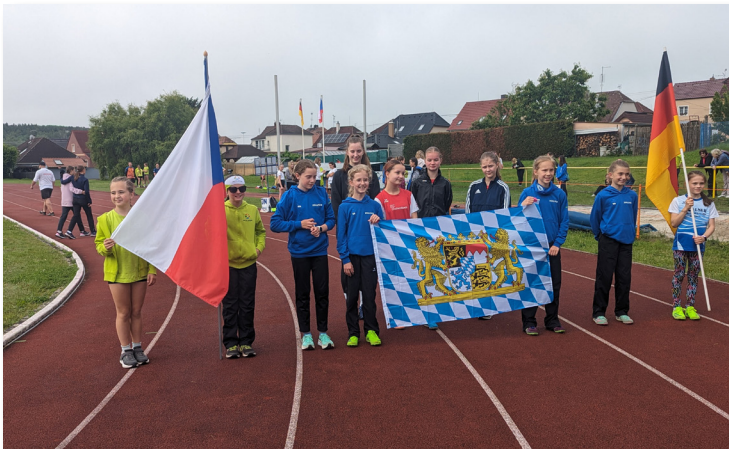
Grenzüberschreitender Schülerwettkampf Oberpfalz mit der Region Pilsen im Mai in Nýřany/CZ