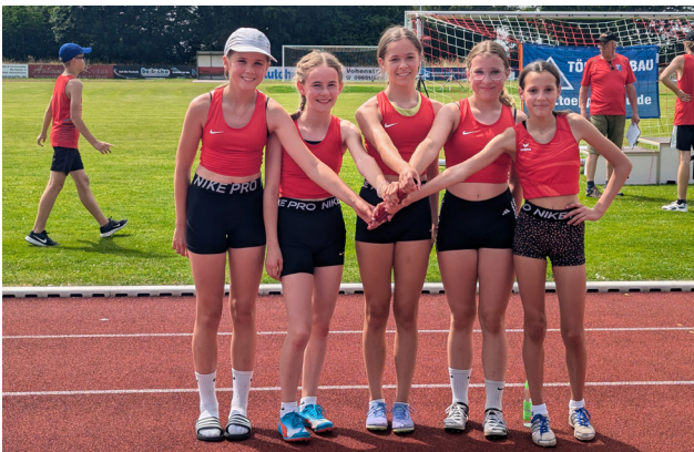
Die Mädels vom TB Jahn Wiesau